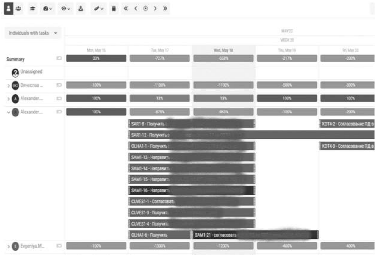
Рисунок 5. Ресурсная диаграмма

Пример ресурсной диаграммы проекта, представлен на рисунке 5.