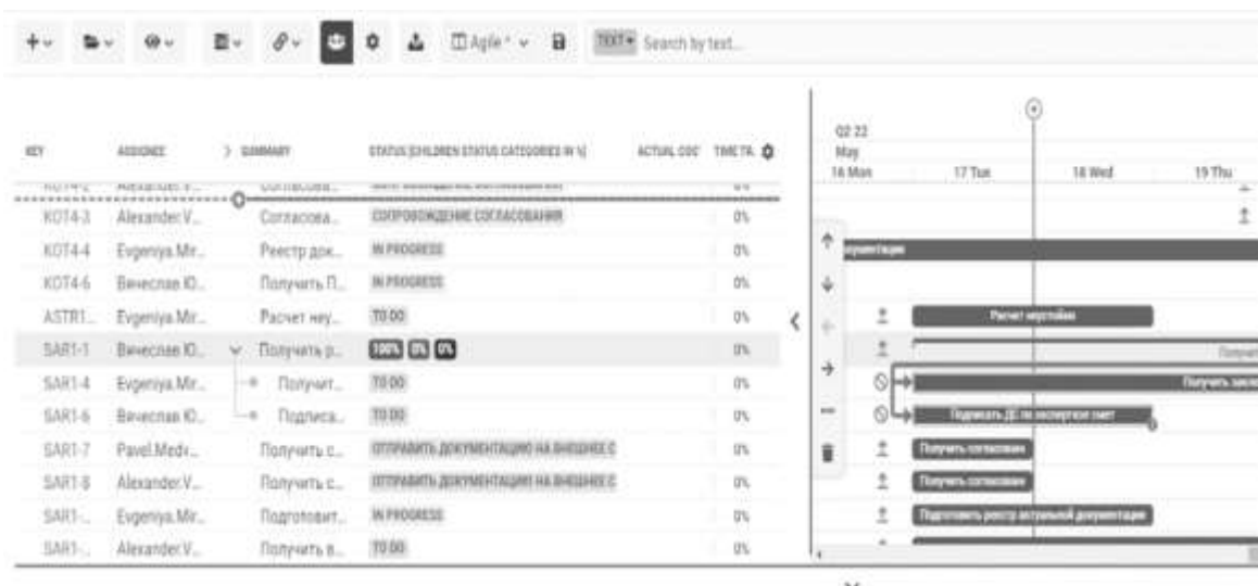
Рисунок 3. Диаграмма Гантта