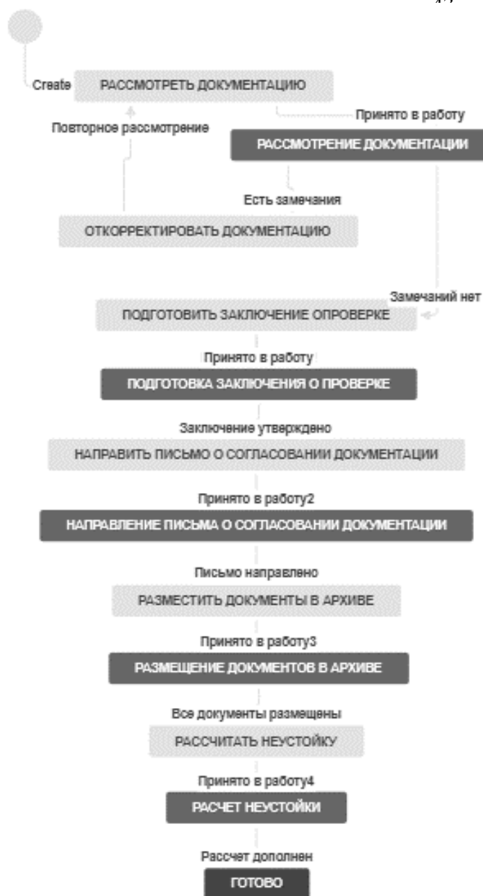
Рисунок 4. Пример индивидуальной схемы бизнес-процесса.

Программное обеспечение «Jira» имеет ряд аналогов, которые в той или иной степени позволяют также осуществлять эффективное управление проектом. В таблице 1 приведен сравнительный анализ наиболее известных аналогов программного обеспечения «Jira».